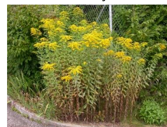
Solidages du Canada

C'est le cas notamment des solidages américains ( solidago canadensis et s. gigantea ) avec leurs hampes florales jaune d'or, du séneçon du Cap ( Senecio inaequidens ) et ses fleurs couleur citron ou encore de la vergerette annuelle ( Erigeron annuus ) avec ses fleurs blanches au cœur jaune.