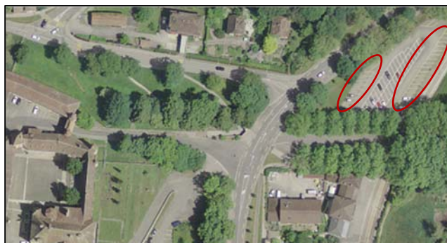
Parking P+R tram

COLOMBIER offre deux zones de stationnement pour les véhicules dont les conducteurs utilisent les transports publics : le Parking du tram, situé à l'Allée des Bourbakis (les places sont marquées en jaune) et le Parking du Bas des Allées (zone en chaille au sud de la Pizzeria des Allées, le long de la voie du tram).