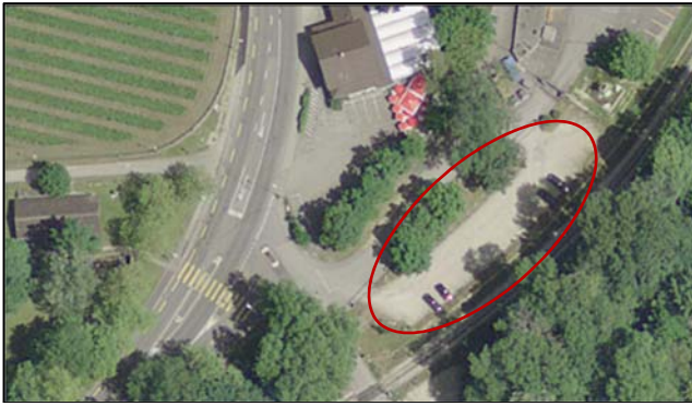
Parking P+R Bas des Allées

Dans le village d' AUVERNIER , un premier lieu de stationnement P+R est à disposition au Parking du Port , situé au sud de la carrosserie d'Auvernier. Un second emplacement se trouve au Parking des Fontenettes , dans la zone centrale du parking.