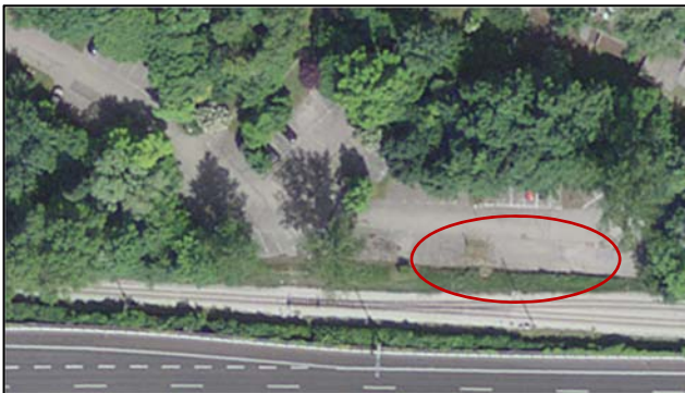
Parking P+R port

Dans le village d' AUVERNIER , un premier lieu de stationnement P+R est à disposition au Parking du Port , situé au sud de la carrosserie d'Auvernier. Un second emplacement se trouve au Parking des Fontenettes , dans la zone centrale du parking.