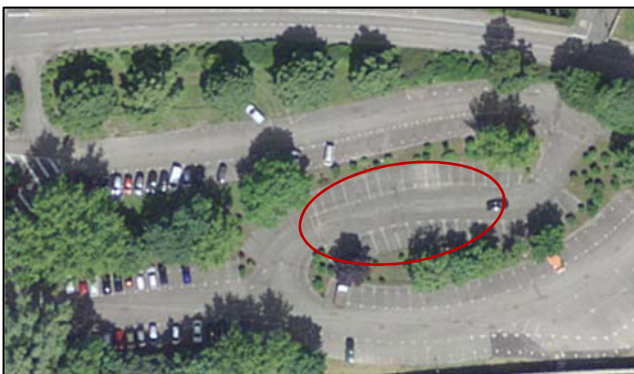
Parking P+R Fontenettes

Lors du stationnement d'un véhicule sur l'un de ces emplacements, la vignette P+R doit être apposée visiblement derrière le pare-brise.