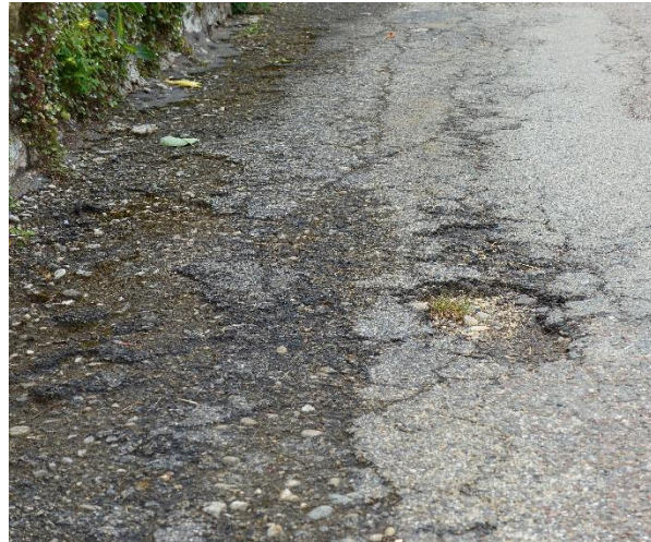
Dégradation état surface