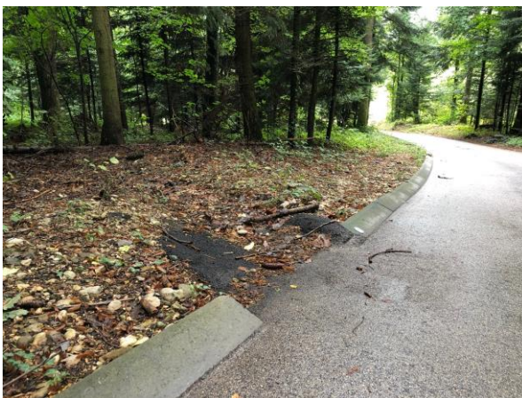
Situation à futur avec bordures type Etat urbaine et création d'exutoires