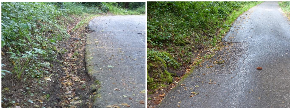
Etat actuel des accotements de chaussée