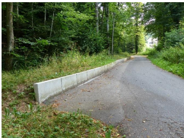
Situation à futur avec bordures type Exacta