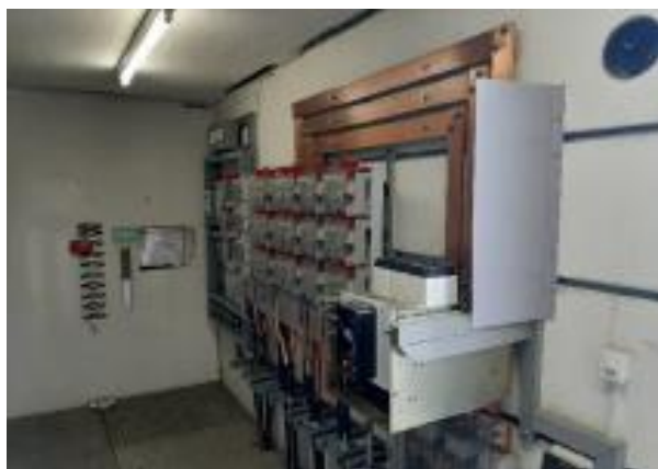
TGBT Station Carrière à Bôle