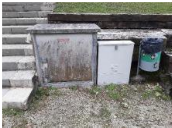
ADBT Champ-Rond à Bôle